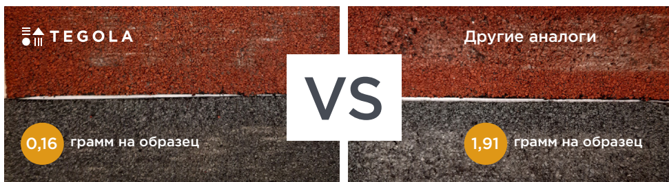
Образцы черепицы после испытаний Brush-Test

Результаты BRUSH-TEST. Испытания на надежность базальтовой посыпки.