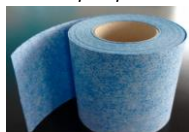
TH 2 Stop Tape